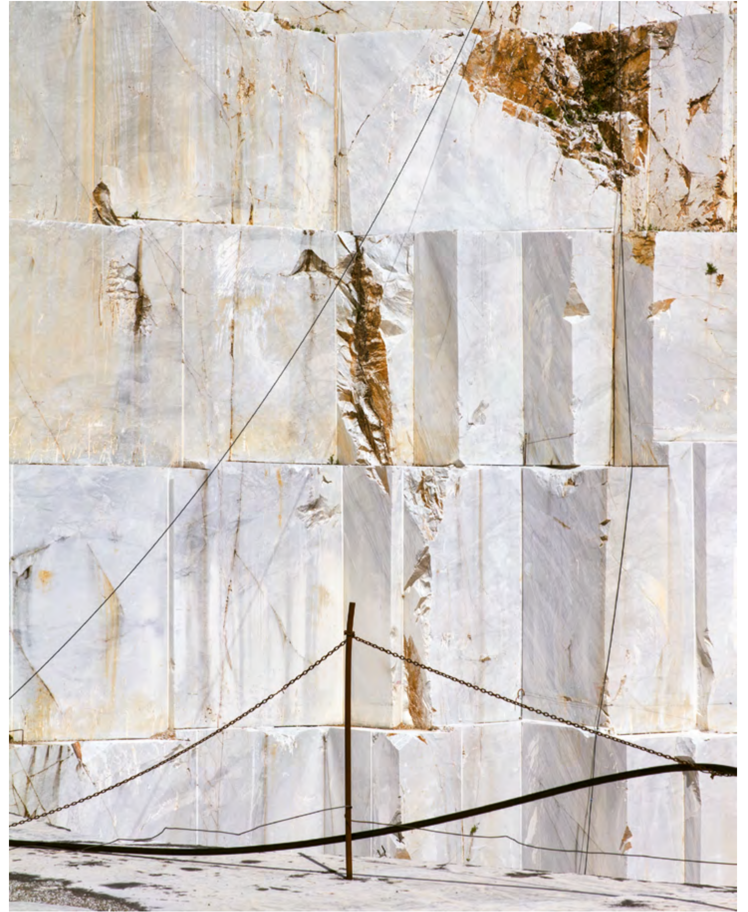
Céline Brunko, Zürich Erschienen im Coucou N° 45, September 2016, in der Rubrik «Bild auf Bild» www.celinebrunko.ch