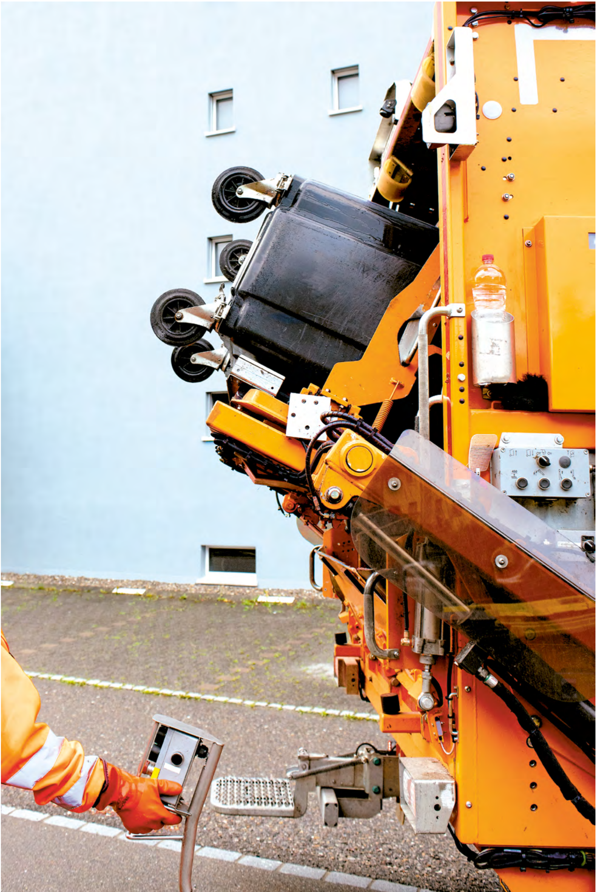
Roman Surber, Winterthur Erschienen im Coucou N° 99, September 2021, zum Thema «Winterthurer Müllabfuhr» www.romansurber.ch