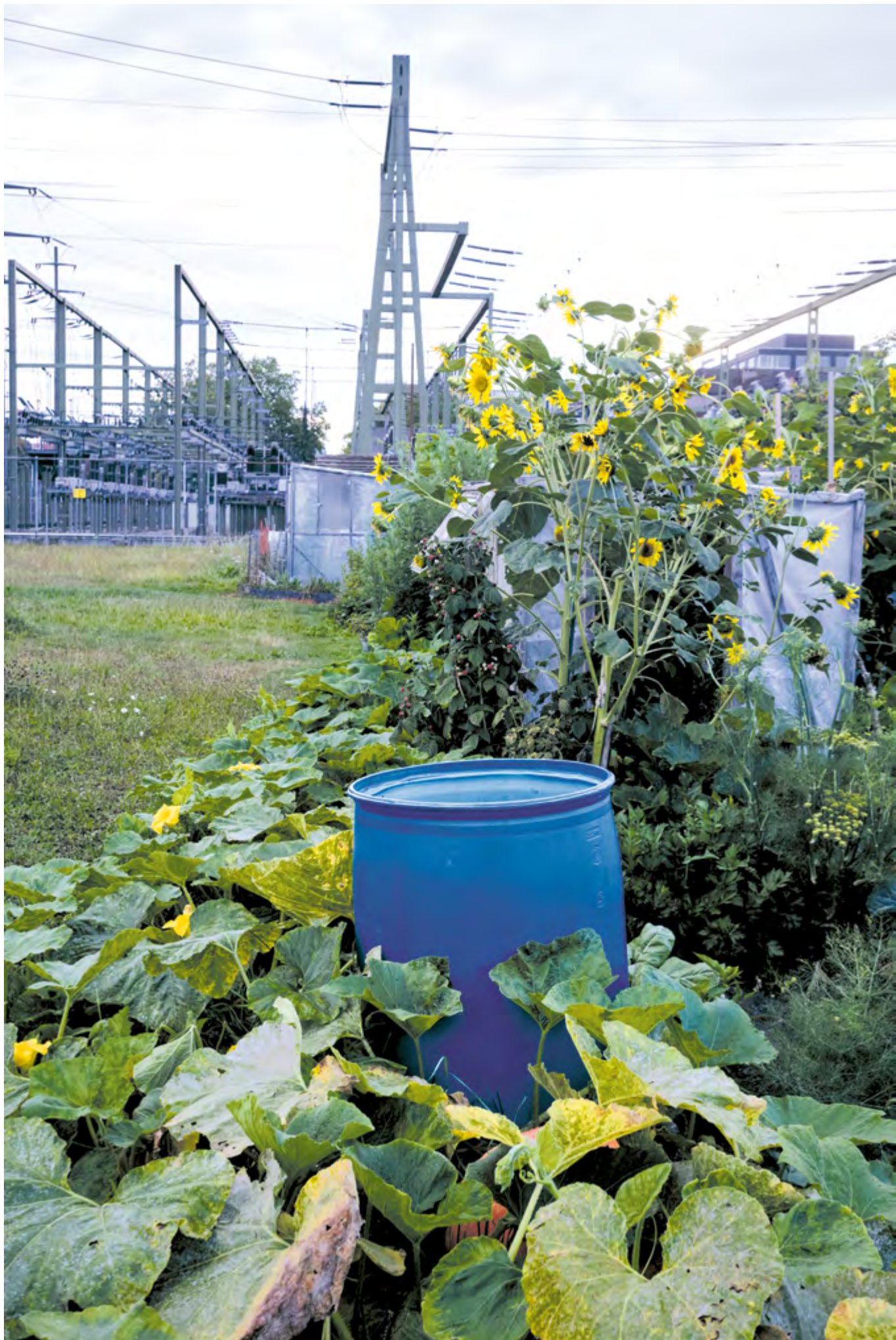
Sabina Diethelm, Winterthur Erschienen im Coucou N° 116, Mai 2023, in einer Bildstrecke zu den ehemaligen Pünften beim Bahnhof Grütze www.sabinadiethelm.com